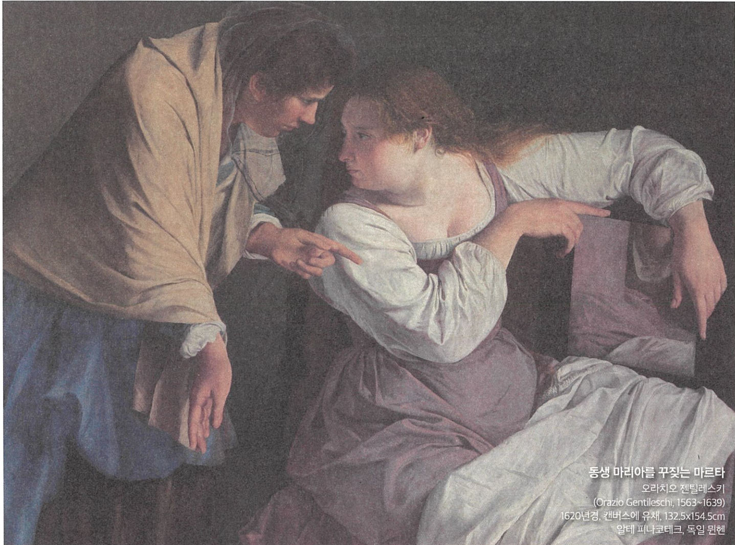
동생 마리아를 꾸짖는 마르타 오라치오 젠틸레스키 (Orazio Gentileschi, 1563~1639) 1620년경, 캔버스에 유채, 132.5x154.5cm 알테 피나코테크, 독일 뮌헨