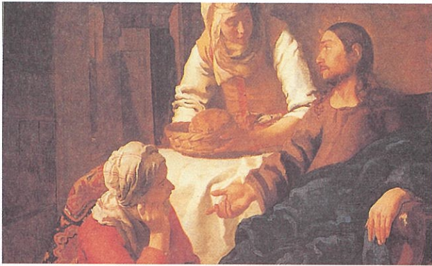
<마르타와 마리아의 집을 방문한 그리스도> 베르메르(Vermeer, 1632-1675), 1655, 유화, 160×142cm, 스코틀랜드 국립미술관, 영국 에든버러

오늘 복음에서 예수님께서서는 “갓가지 시중 드는 일로 분주한” 마르타보다 “주님의 발치에 앉아 그분의 말씀을 듣고 있었”던 마리아가 “좋은 몫을 선택하였다.”(루카 10, 39-42)고 말씀하십니다. 교회는 이 구절을 읽으며 마리아로 대변되는 관상적 삶(vita contemplativa, 비타 콘템플라티바)과 마르타로 대변되는 활동적 삶(vita activa, 비타 악티바)에 대해서 논해 왔습니다.